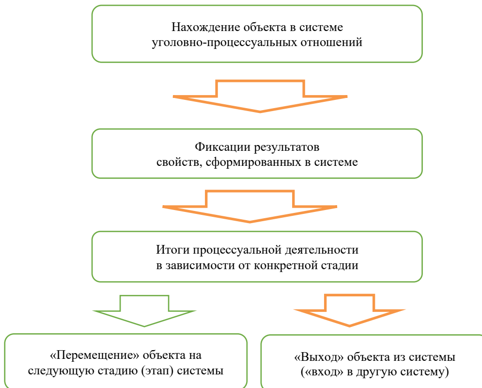
Рисунок 2. Виды деятельности субъектов в системе, обращенные к объекту (составлено авторами)

Здесь обращает на себя внимание последняя стадия. У объекта системного воздействия в судопроизводстве, может быть два варианта «системных перемещений»: